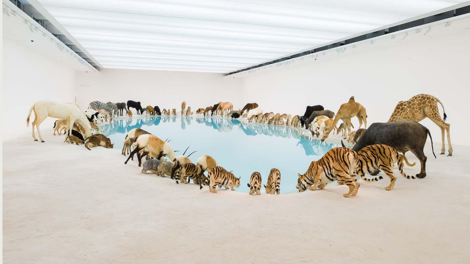
Imagen: Cai Guo Qiang