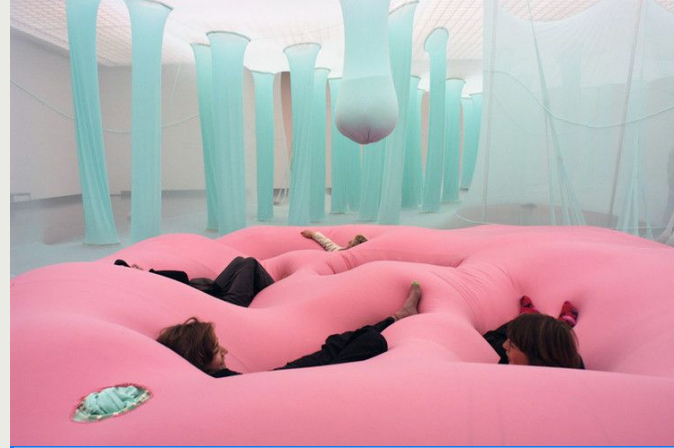
Imágen: Ernesto Neto

El arte y las ideas de artistas contemporáneos son modelos poderosos que promueven la posibilidad de abordar temas interdisciplinariamente, impulsan la curiosidad, fomentan la indagación y funcionan como disparadores para iniciar diálogos y debates sobre el mundo actual y los temas que afectan nuestras vidas.