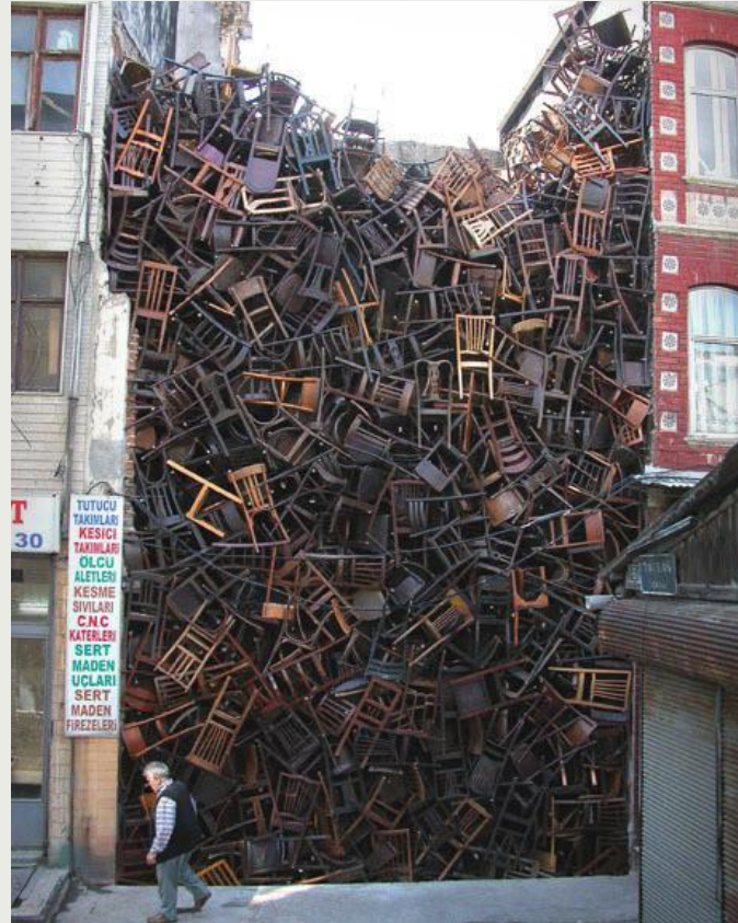
Imagen: Doris Salcedo

Nuestro taller relaciona la teoría con la práctica. En cada encuentro exploraremos activamente el arte contemporáneo desde una variedad de contextos, conectándolo con tu perspectiva/intereses. A través de la investigación, la reflexión y, en algunos casos, el trabajo con distintos materiales, seremos creadores y cuestionadores de las problemáticas de nuestro tiempo. Las obras de determinados artistas contemporáneos serán los disparadores para trabajar con distintas temáticas actuales divididas en los siguientes ejes: identidad y género / memoria y colonialismo / cuerpo / ciencia y tecnología / espiritualidad / crisis ambiental / lugar.